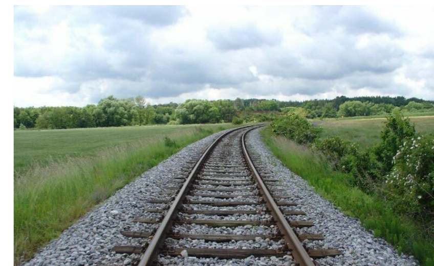
Bahnschotter ist wesentlich für die Erhaltung der österreichischen Infrastruktur