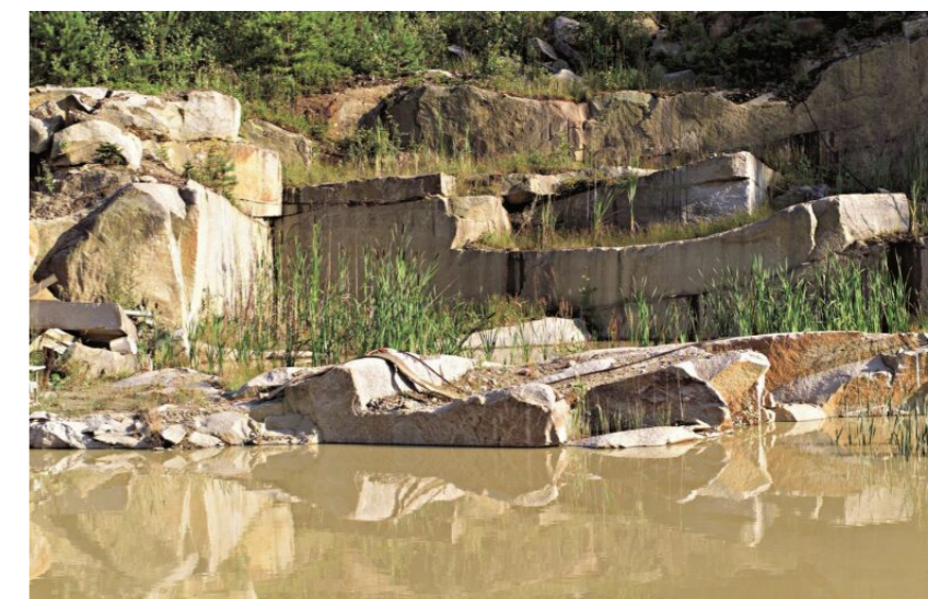
Biotope in Steinbrüchen, Sand- und Kiesgruben sind wichtige ökologische Nischen für vom Aussterben bedrohte Tiere

GEWINNUNG MINERALISCHER ROHSTOFFE IN ÖSTERREICH. In Österreich befindet sich statistisch gesehen in jeder zweiten Gemeinde eine aktive Rohstoffgewinnungsstätte. In den rund 1.300 Gewinnungsstätten – 950 Sand- und Kiesgruben und 350 Steinbrüchen – werden rund 100 Millionen Tonnen mineralische Rohstoffe wie Sand, Kies, Naturstein, Kalk, Lehm, Ton, Mergel, Schiefer, Gips und Industriemineralien gewonnen. Die Rohstoffe gewinnenden Unternehmen Österreichs gewährleisten eine ausgezeichnete Nahversorgung mit einem geringen Transportradius von nicht mehr als 25 Kilometern – dies reduziert Transportkosten und Verkehr und schont vor allem Anrainer, Umwelt und Straßen. In ländlichen Regionen, in denen Jobs Mangelware sind, sichert die Baurohstoffwirtschaft ca. 5.000 Arbeitsplätze. Ein Großteil der benötigten Rohstoffe wird für Straßen-, Gleis- und Wegebau, für Kläranlagen und Kanalbau verwendet. Je ein Sechstel entfällt auf Wohn- und Wirtschaftsbauten wie Einfamilienhäuser, Kindergärten und Schulen. www.ForumRohstoffe.at