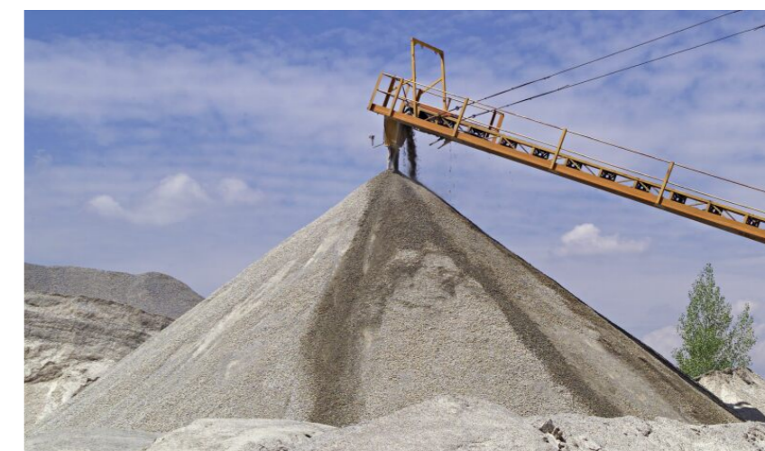
In Österreich werden jährlich rund 100 Millionen Tonnen Sand, Kies, Schotter und Naturstein gewonnen